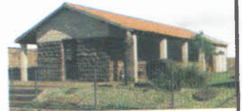
MUSEU MONSENHOR ESTANISLAU WOLSKI